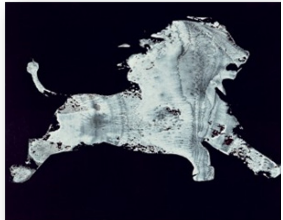
Oscar Domínguez promovió la "decalcomanía"